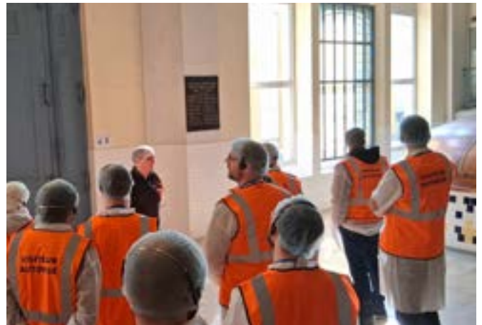
Brasserie de Champigneulle

« Je tenais à vous remercier pour votre accueil samedi matin. Mon fils a particulièrement apprécié la visite, d'autant plus que nous avons pu être au plus proche des installations. Il est reparti enthousiaste, avec un intérêt qu'il n'avait pas auparavant pour les métiers de l'industrie – ce qui était précisément l'objectif de notre démarche. »