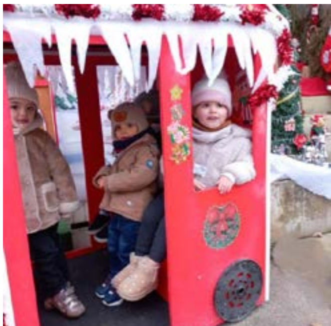
Noël - Hirondelle à Custines