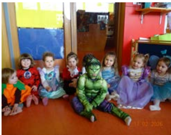
Carnaval - Archipel à Pompey