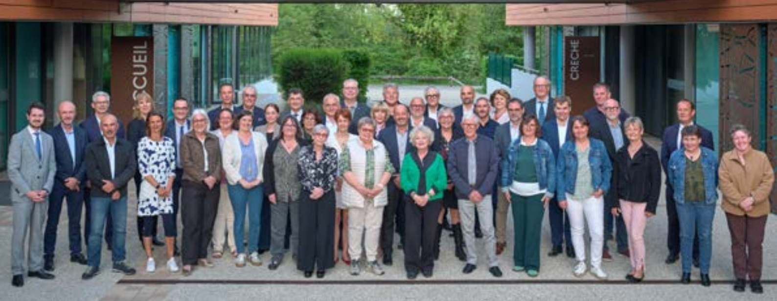
Les 45 délégués communautaires nouvellement élus à la Communauté de communes du Bassin de Pompey.