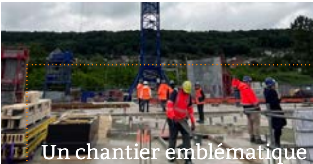
Un chantier emblématique

Ces clauses sociales prévues dans nos achats publics agissent comme un levier vers l'emploi et l'inclusion.