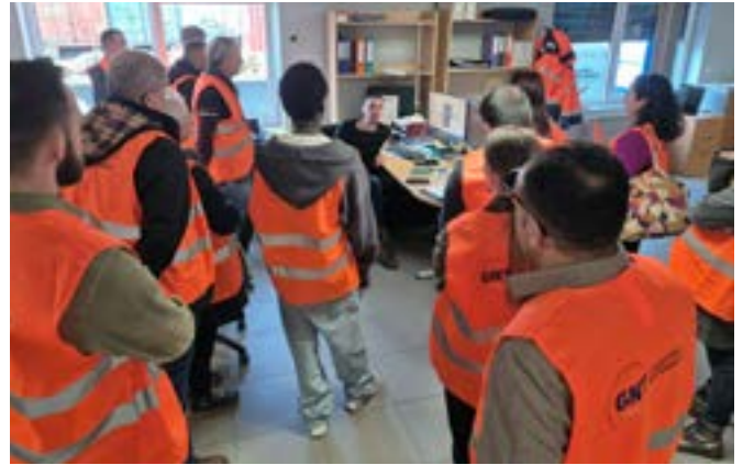
GNT Industrie Maintenance

Scolaires, demandeurs d'emploi et grand public ont pu rencontrer les équipes, explorer des métiers variés et constater que l'industrie est un secteur moderne et innovant. L'objectif ? Changer les idées reçues et montrer que ces entreprises recrutent et forment pour l'avenir.